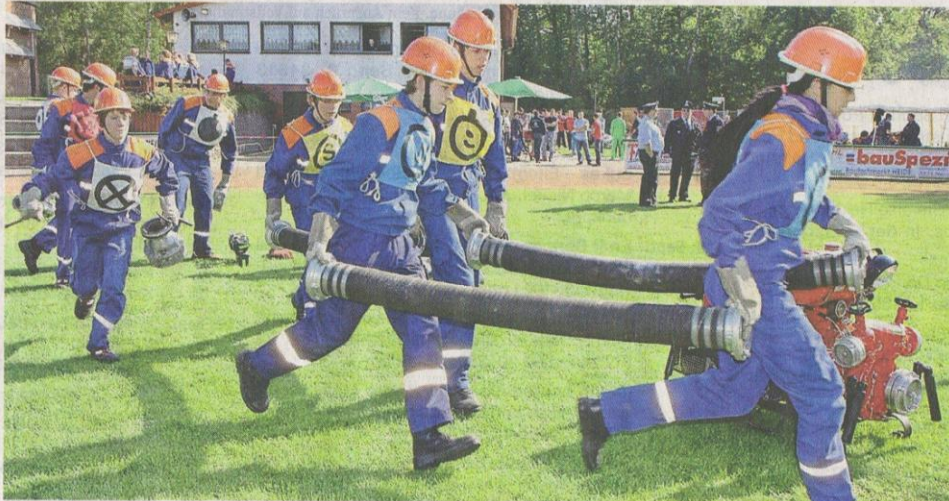
Voller Einsatz bei der gemischten Jugendfeuerwehrgruppe aus Stadtallendorf- Mitte und Schweinsberg.

Sie soll für die jugendlichen Floriansjünger sowohl Prüfstein als auch Auszeichnung sein, um sich damit auf ihre praktische Hilfstätigkeit an den Mitmenschen vorzubereiten. Insgesamt fünf Disziplinen mussten von den zwölf Teams aus Biedenkopf, Ebsdorfergrund (I und II), Fronhausen, Twistetal, Dautphetal, Gladenbach-