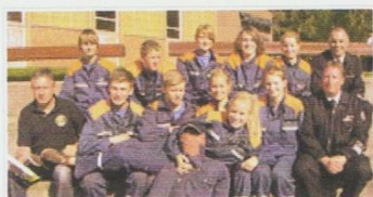
Sie freuen sich nach dem Erhalt der Leistungsspang... | mittelhessen.de

Gladenbach-Rüchenbach/Neustadt (mi). Zwölf Jugendfeuerwehren mit über 100 Akteuren haben die Prüfung für die Leistungsspange auf dem Sportplatz in Neustadt gemeistert. Nach vielen Jahren Pause stellte sich auch wieder ein Team aus dem Gladenbacher Stadtgebiet den Aufgaben.